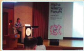
2014.07.12 2014 Alpha Allergy Forum