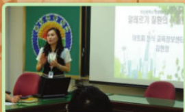
2014.09.22 주왕초등학교 교사대상 알레르기 예방관리