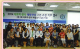
2014.08.18~20 제2회 아토피·천식 예방관리 심포지움