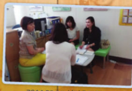
2014.09.25 서감초등학교 질병관리본부 안심학교 현장점검