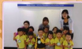
2014.09.23 감만어린이집 새싹반 센터체험프로그램