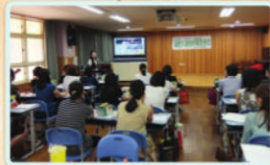
2014.07.21 주왕초등학교 학부모대상 알레르기 예방관리