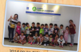
2014.09.22 감만어린이집 꽃잎반 센터 체험프로그램