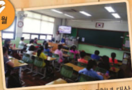
2014.09.05 효림초등학교 3학년 대상 알레르기 예방관리