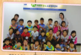
2014.09.15 감만어린이집 열매반 센터 체험프로그램