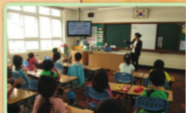
2014.09.23 연제초등학교 2학년대상 알레르기 예방관리