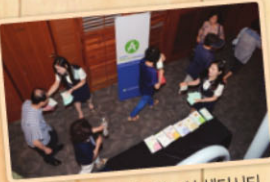
2014.07.29 KNN건강교실 센터시티 센터홍보