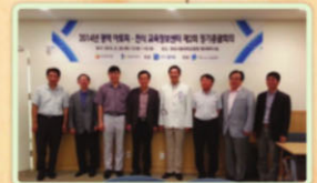
2014.08.28 2014년 광역 아토피·천식 교육정보센터 제2회 정기총회