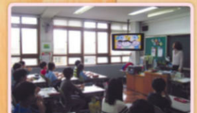
2014.09.24 해운대초등학교 4학년대상 알레르기 예방관리