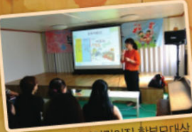
2014.09.25 감만어린이집 학부모대상 알레르기 예방관리