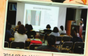
2014.07.10 사상구보건소 관내주민대상 알레르기 예방관리