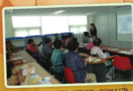
2014.09.25 사하 사랑채노인복지관 알레르기 예방관리