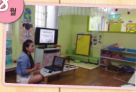
2014.08.05 엔젤어린이집 보육교사대상 알레르기 예방관리