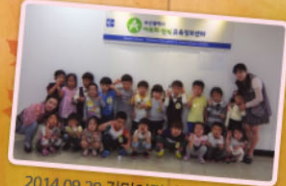
2014.09.29 감만어린이집 꽃잎반 센터 체험프로그램