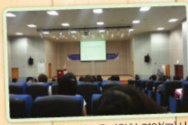
2014.07.30 김해교육지원청 영양교사, 조리사대상 알레르기 예방관리