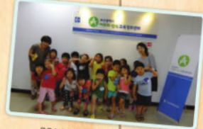
2014.08.07 엔젤어린이집 센터체험프로그램