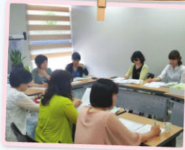
2014.05.29 보건소 담당자간담회