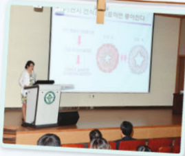
2014.05.14. 개소 기념 심포지엄