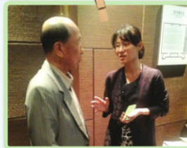
2014.05.15. 롯데광복점 건강강좌 센터홍보