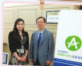
2014.06.18. 금정구 의사학술대회 홍보부스