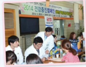
2014.05.28. 고신대학교 한빛라운지 알레르기 정보제공,상담 및 알레르기 검사