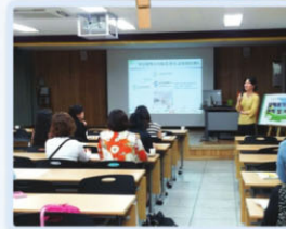
2014.06.05. 신정초등학교 학부모 대상 알레르기질환 관리