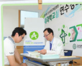
2014.06.21. 고신대학교 내과학교실 연수강좌 - 센터홍보