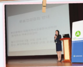
2014.06.18. MBC 건강교실 센터홍보