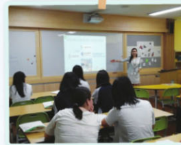
2014.06.16. 부흥고등학교 아토피 환자 대상 올바른 알레르기 관리