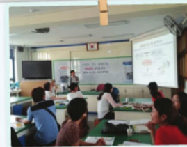
2014.06.05. 서감초등학교 교직원대상 알레르기 예방관리