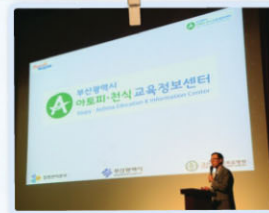
2014.06.20 롯데백화점건강강좌 센터홍보