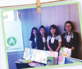
2014.06.24. 부울경 지화- 홍보부스