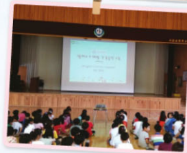
2014.06.05. 서감초등학교 전 학년 대상-알레르기 예방 건강증진 교육