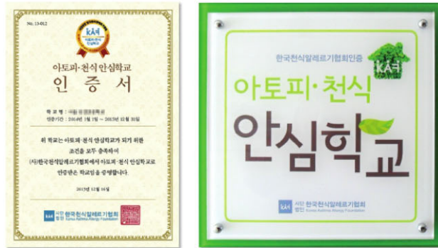
〈(사)한국천식알레르기협회 인증 아토피·천식 안심학교인증서와 현판〉