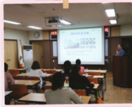
2014.06.13. 김해시 보건소 보건·보육교사 대상 알레르기질환 관리