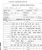
환아관리카드에 기록하여 관리

서면평가와 현장평가 모두 통과되면 향후 1년간 (사)한국천식알레르기협회에서 인정하는 아토피·천식 안심학교가 됩니다.