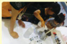
악산성 비누 만들기