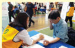
알레르기 질환 상담