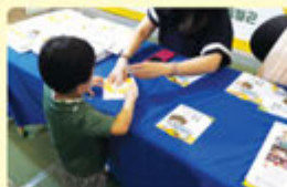
아토피 피부염 예방 팝업북 만들기