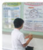
증상완화제 사용법 숙지 확인