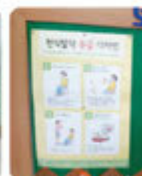
보건실에 비치된 천식 응급상황대처법