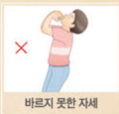
바르지 못한 자세