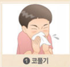
① 코 풀기